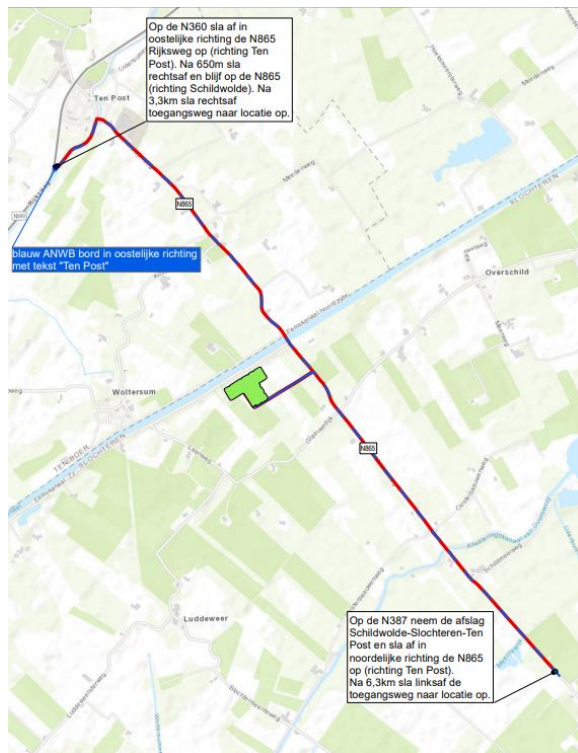
Rijroute Locatie de Paauwen

Deze werkzaamheden worden uitgevoerd tijdens reguliere werkdagen, tussen 07.00 uur tot 19.00 uur. In deze periode zijn er mensen aanwezig op de locatie. Verder is er sprake van extra verkeersbewegingen in verband met het regelmatig aan- en afvoeren van materiaal.